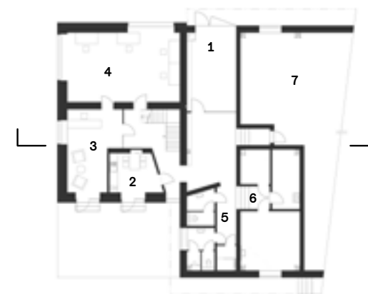
Púdorys 1. NP