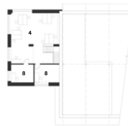
Púdorys 2. NP

en— Domek skladníka, přímo napojený na typický drážní skladový objekt z konce 19. století, byl v devadesátých letech 20. století necitlivě přestavěn pro administrativní účely. Rekonstrukce usiluje o navrácení původních kvalit skladu a radikální přestavbu skladníkovy domu pro účely kancelářského zázemí spediční firmy. Úpravy směřovaly k odstranění neforemné sedlové střechy a jejímu nahrazení prostorově efektivnějším patrem se střešou plochou. Do samotného objektu skladu byl umístěn hlavní vstup a technické zázemí.