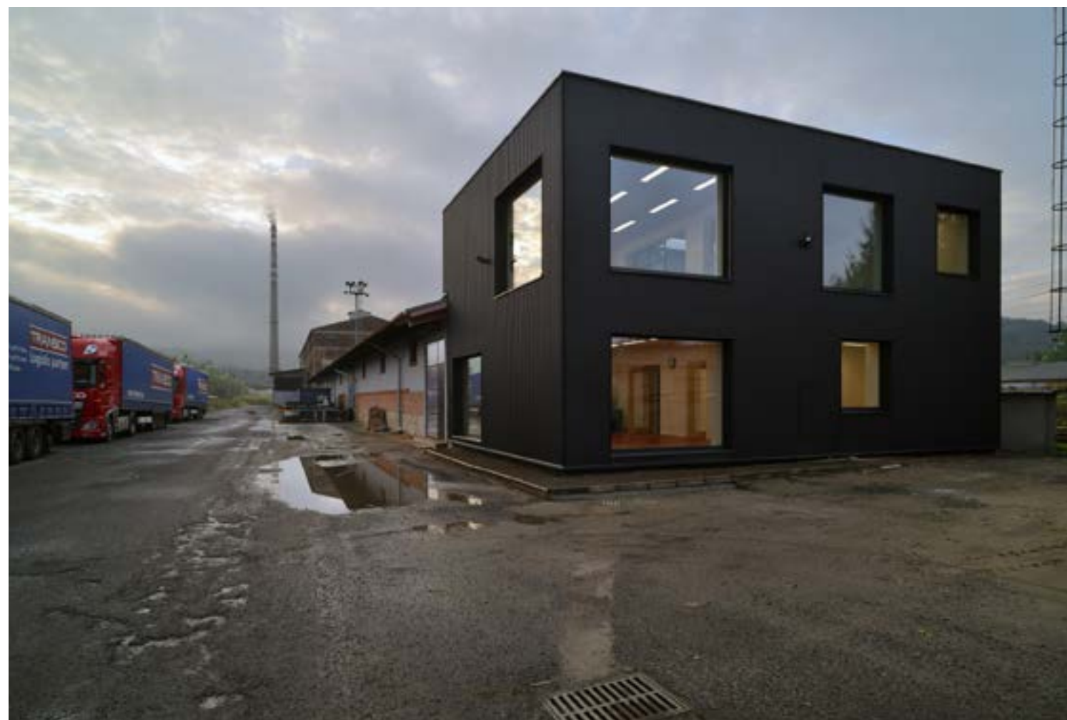
1 Po úvahách o vestavbě firemního zázemí do prostoru skladu autoři dospěli k záměru oživit špatně rekonstruovaný a ladem ležící skladníkův domek; pro stavebníka – spediční firmu je objekt výhodně situován v paradoxu periferie uvnitř městské struktury.