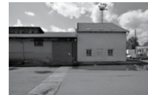
2 Původní stav.