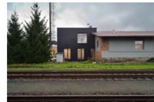
4 Přilehlý historický objekt je typickou ukázkou drážního skladu, jakých jsou podél drah desítky; vyznačuje se hezkými proporcemi, jednoduchou konstrukcí a účelností.