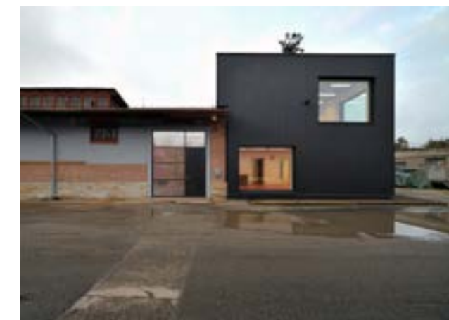
3 Užití černého profilovaného plechu na fasádě rekonstruovaného objektu odkazuje k principu kontejnerové dopravy.